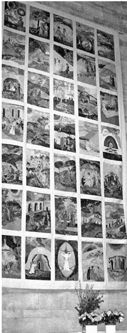
Fastentuch in der Pfarrkirche Hinterbrühl

Nun wissen wir Christinnen und Christen zu gut, dass wir Gott nicht „gepachtet“ haben und auch nicht den Glauben. Wir sind uns bewusst, dass es