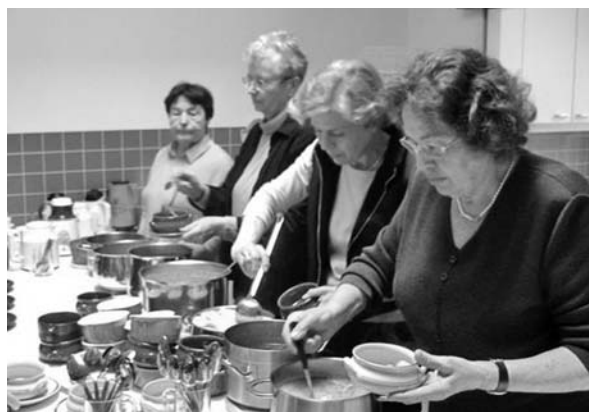
Pfarrcafe – und am Familienfasttag auch Suppenküche: EUR 330,- wurden „erkoht“