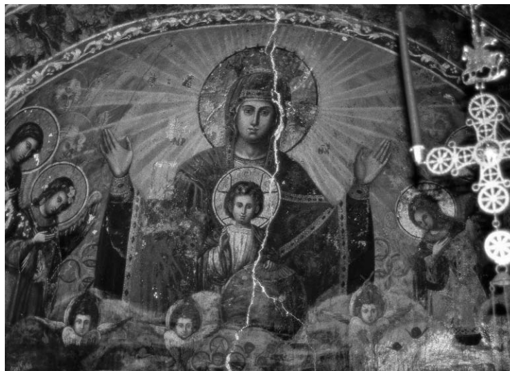
Muttergottes mit Kind – ein Spiegel der weiblichen Seite Gottes

Sie ist nicht Göttin, nicht Mutter- gottheit. Aber wenn wir uns an sie wenden, genießen wir einen Gna- denstrom, der göttlichen Ur- sprungs sein muss. Da dieses göttliche Geschenk uns über sie erreicht, wird uns dessen mütterli- che Wärme durch ihr Frausein un- mittelbar bewusst. Wahrschein- lich haben das Menschen immer