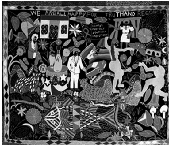
Die ganze Buntheit eines geprüften Landes: Leben in Südafrika auf einem Wandteppich

Allen, die mitgearbeitet haben, und allen, die gekommen sind: „ziyabonga“ (Zulu), „baie danhie“ (Afrikaans), „thank you“ und „danke schön!“