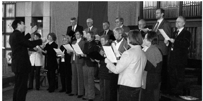
Singen ist doppelt beten: Hier der Kirchenchor der Pfarre Südstadt

Jeweils am Montag – von 19.30 bis 21 Uhr – probt auch der Kirchenchor Hinterbrühl im Pfarrheim. Er sucht ebenfalls „sehr lebhaft“ Verstärkung durch neue Sängerinnen und Sänger. Jeder Zuwachs löst Freude aus!