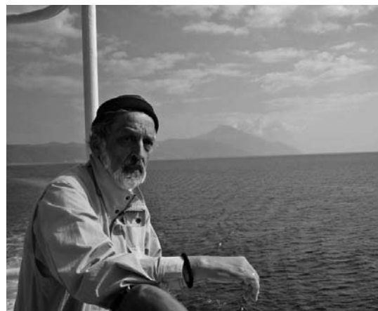
Der Autor unterwegs zum Athos (Hintergrund)