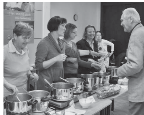
Die Ehrenamtlichen: Hand anlegen, wo notwendig, aber auch miteinander feiern – und für soziale Zwecke Suppen kochen ...