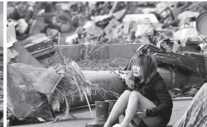
Bilder des Schreckens aus dem Zentrum der großen Flut: Gott hat seine Schöpfung in die Freiheit entlassen.